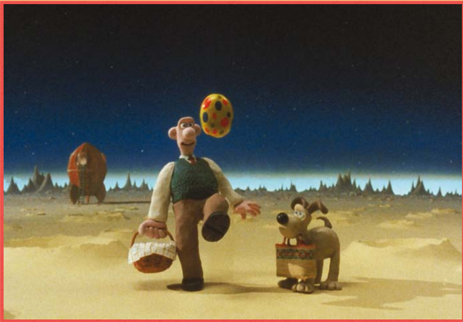
Une grande excursion