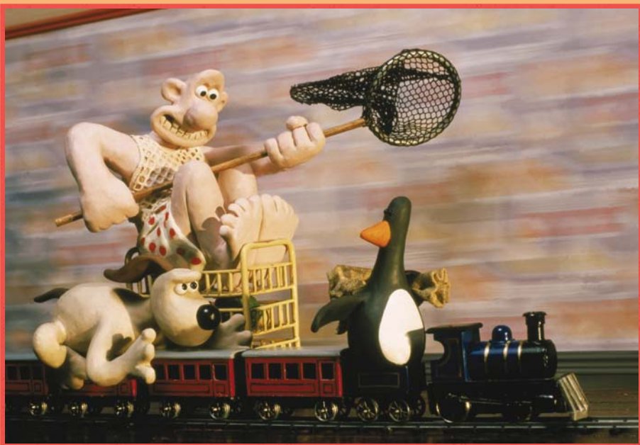
Un mauvais pantalon