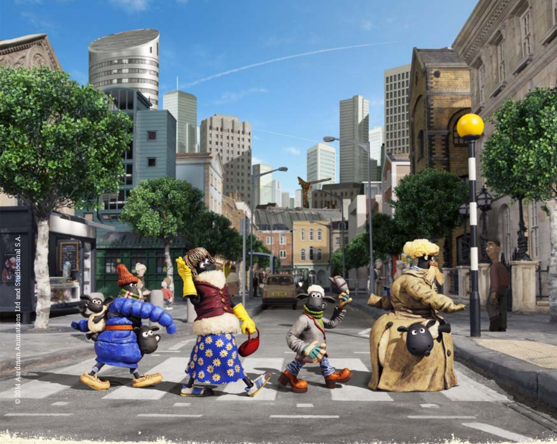
Shaun le mouton - Le film