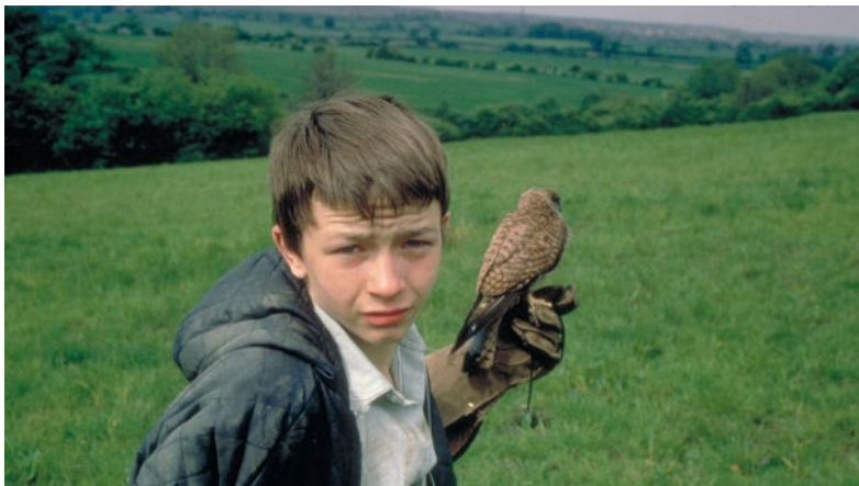
Kes , Ken Loach (1969)

- Le cinéma social britannique contemporain : Mike Leigh, Stephen Frears et Ken Loach