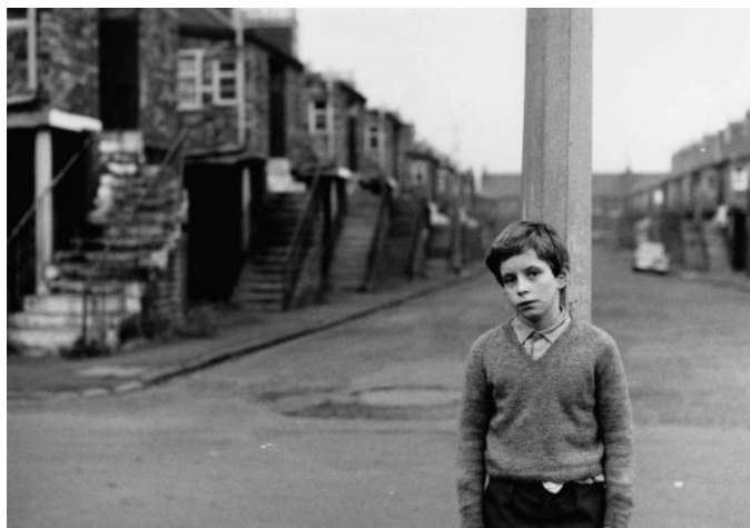
My Childhood (1972)