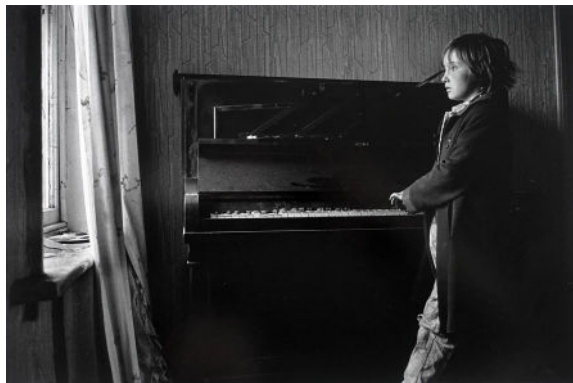
Série Step by Step (1987)