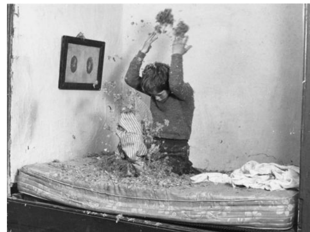
My Ain Folk (1973)