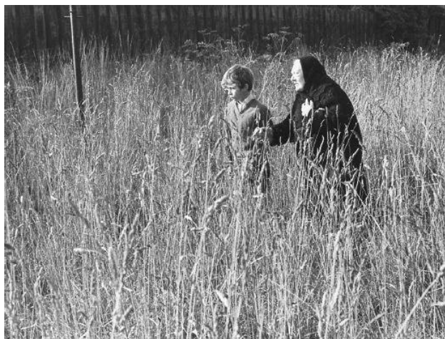
My Childhood (1972)

- La trilogie Bill Douglas (1972 – 1978) : l'enfance et la jeunesse d'un enfant de la classe ouvrière dans une petite ville minière.