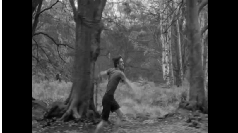
La solitude du coureur de fond (Tony Richardson, 1962)