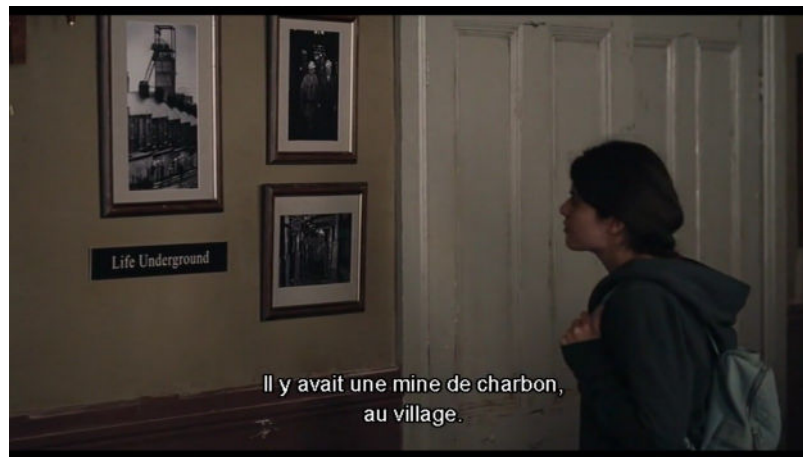
The Old Oak , Ken Loach (2023)