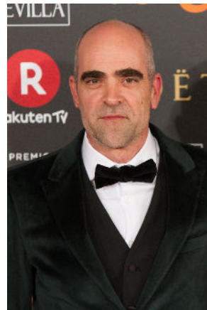
Luis Tosar (Rafa)

En los márgenes (2022) L'Immensità (2022) Madres paralelas (2021) Competencia oficial (2021) Dolor y Gloria (2019) Volver (2005)