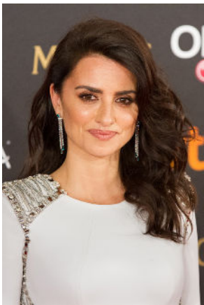
Penelope Cruz (Azucena)

En los márgenes (2022) L'Immensità (2022) Madres paralelas (2021) Competencia oficial (2021) Dolor y Gloria (2019) Volver (2005)