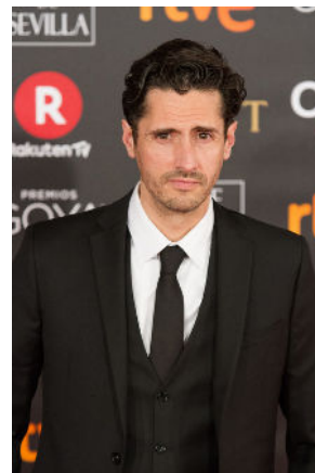
Juan Diego Botto (Manuel)

En los márgenes (2022) El Escuadrón Suicida (2021) No me mires a los ojos (2021) Los europeos (2020) Rocambola (2019) Vete de mi (2006)